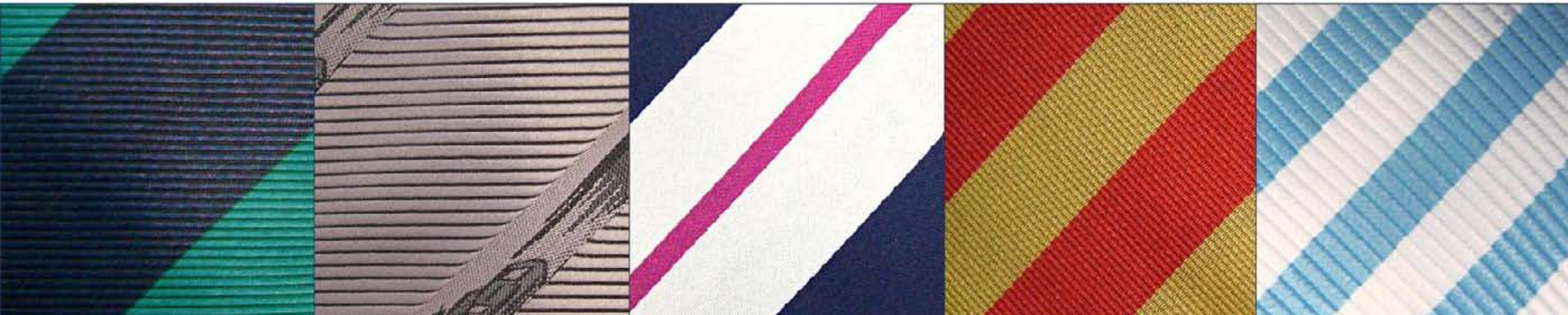
grobe reps gros