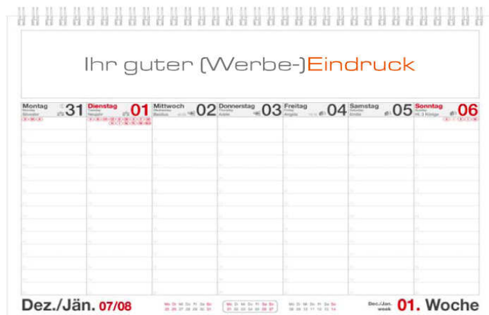
Beispiel: Business A4 , 7-spaltig mit Einzelblatteindruck