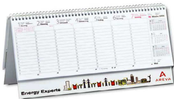
Beispiel: Exklusiv quer mit 4c-Digitaldruck-Aufkleber

Alle Preise gelten ab Werk (Produktionsstätte) zuzügl. ges. Mwst. und ges. ARA-Verpackungsgebühr. Zahlbar innerhalb 14 Tagen ohne Abzug. Bei Neukunden (1. drei Bestellungen) nur gegen Barzahlung bei Lieferung oder Vorkassa. Bei Zahlungsverzug werden bankübliche Verzugszinsen berechnet. Nachträgliche Änderungen (Autorkorrekturen), unvorhersehbare Mehrarbeit u. dgl. werden nach tatsächl. Aufwand separat abgerechnet. Aus drucktechnischen Gründen gilt bei bedruckten Waren eine Über- bzw. Unterlieferung bis zu 10 % als vereinbart. Zum Druck erforderliche Nebenprodukte bleiben unser Eigentum. Bis zur vollständigen Bezahlung bleiben alle Waren unser uneingeschränktes Eigentum und dürfen weder verteilt, verkauft noch sonst wie weitergegeben werden. Gerichtsstand für beide Teile ist Villach. Im übrigen gelten unsere Allgem. Liefer- u. Geschäftsbedingungen (einzusehen unter http://druckboerse.at/agb.html ). Irrtum und Druckfehler vorbehalten.